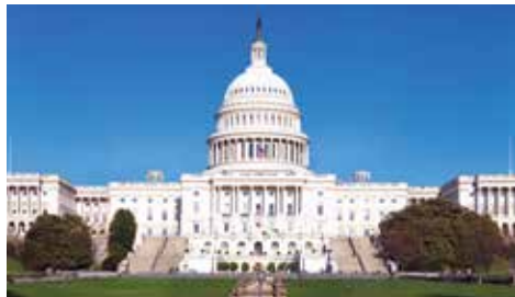
Le Capitole des États-Unis à Washington

Depuis plus de 140 ans, York conçoit et installe des systèmes de traitement de l'air dans les constructions parmi les plus prestigieuses au monde. Et depuis plus de 40 ans, York est la marque la plus choisie par les consommateurs canadiens lorsqu'il s'agit d'assurer confort en toute saison aux êtres chers. Rien de plus naturel que de confier son confort à York, car chaque appareil est conçu et fabriqué en Amérique du Nord sous étroite surveillance et selon les procédés de fabrication des plus sophistiqués, une assurance de la qualité et de la fiabilité des produits.