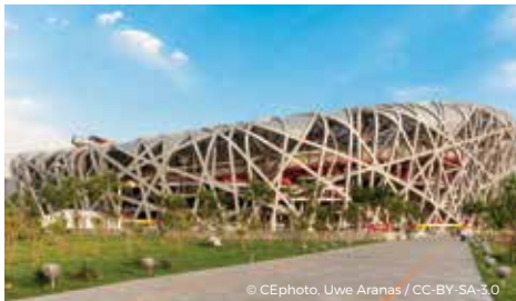
Le Stade national de Pékin