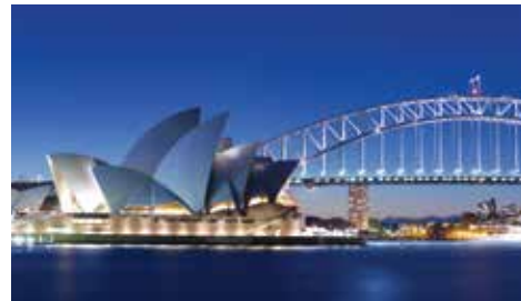
L'opéra de Sydney